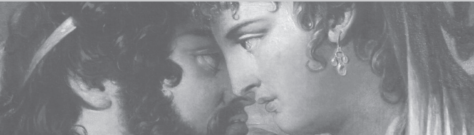
Júpiter y Juno , James Barry (1773). Detalle